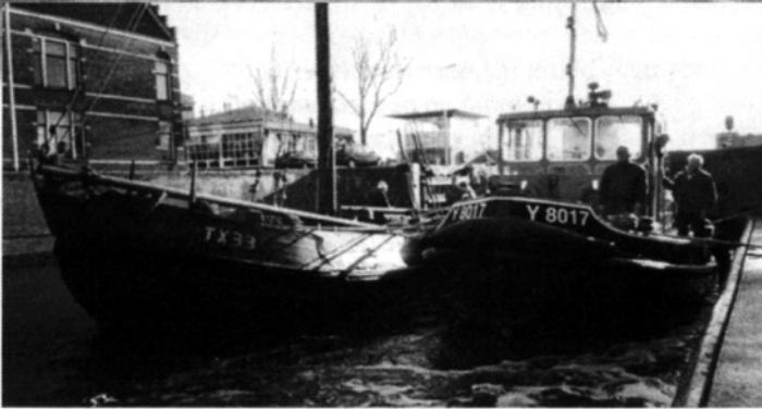
De blazer op weg naar Den Helder, met als tussenstop de sluis in Zaandam

D e blazer TX 33 heeft haar tijdelijke thuishaven Kortenhoef verlaten en koers gezet naar Den Helder. Tijdens de periode van verkenning van de mogelijkheden om tot restauratie van het schip te komen, is er een contact tot stand gekomen tussen de Stichting Behoud Blazer en de Oude Rijkswerf Willemsoord in Den Helder. Hier wordt voortvarend gewerkt om dit 26 hectare grote voormalige marinekwartier - behalve de blazer TX 33 ook een uniek erfgoed - nieuw leven in te blazen.